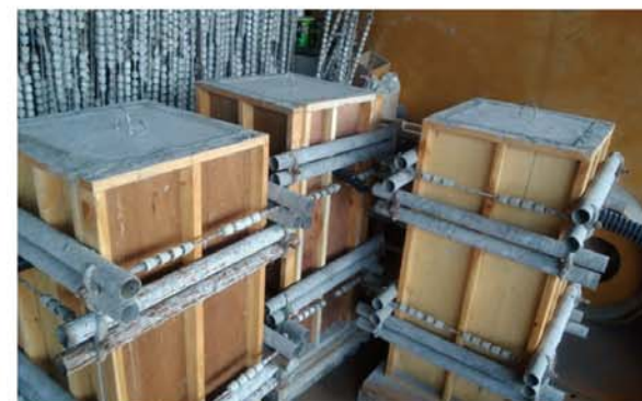
ご指定の鉄筋を制作